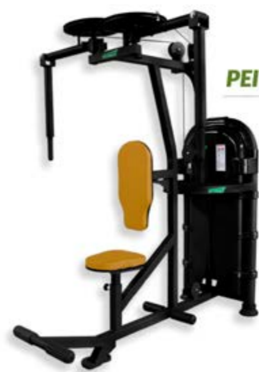
PEITORAL DORSAL FLY