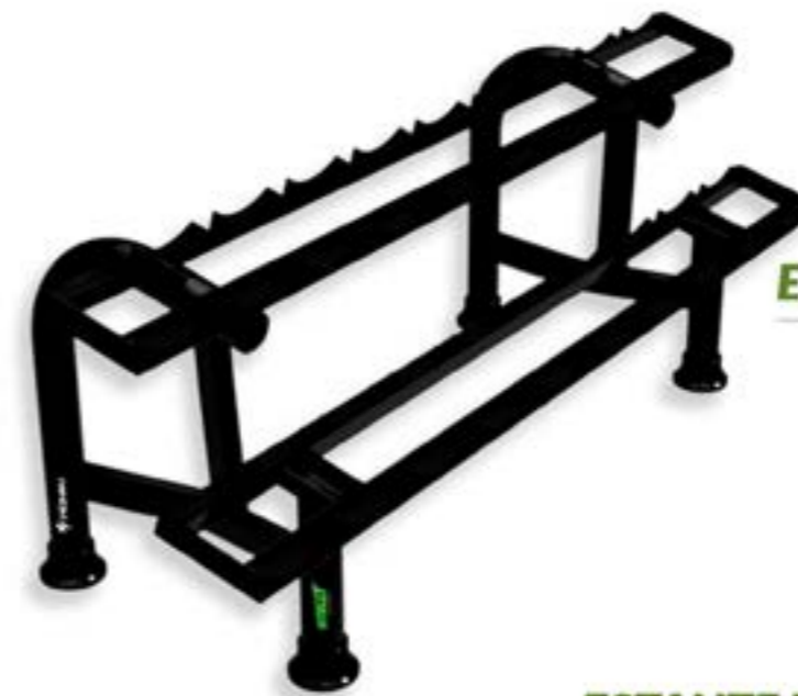
ESTANTE PARA DUMBELLS