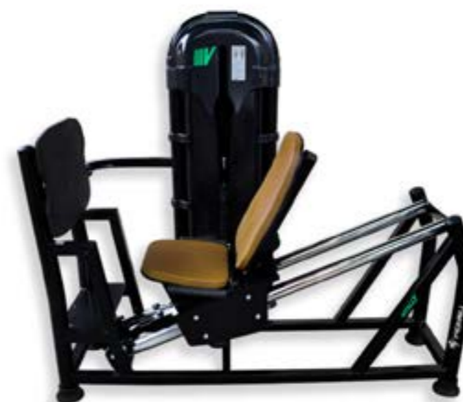
LEG PRESS 180°