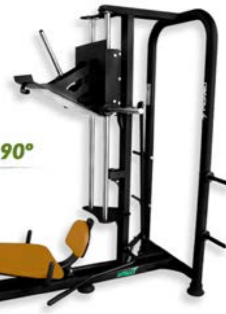
LEG PRESS 90°