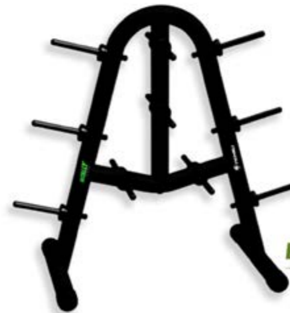
ESTANTE PARA ANILHA