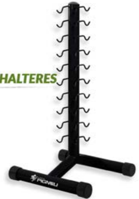
ESTANTE PARA HALTERES