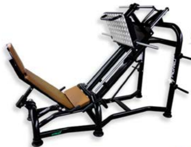
LEG PRESS 45°