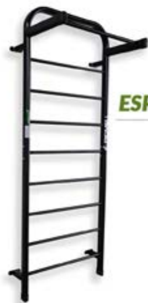
ESPALDAR DE PAREDE