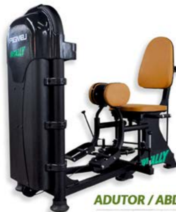
ADUTOR / ABDUTOR